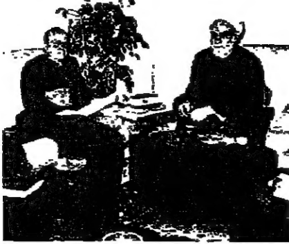
عند شمس الدين